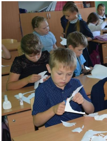
МО Балаганский район МБОУ Балаганская СОШ №2 Изготовление бумажных «Белых голубей» (1-4 классы)