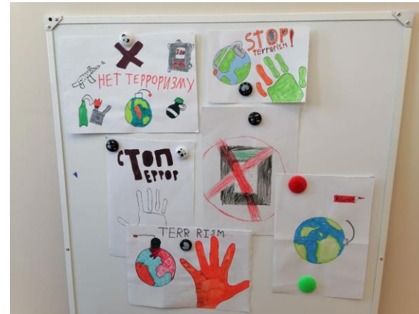
МО Балаганский район МБОУ Коноваловская СОШ Конкурс рисунков «Плакат мира» (1-4 классы)