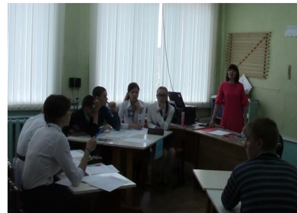
МО Балаганский район МБОУ Заславская СОШ Классный час «Толерантность – дорога к миру» (7 класс)