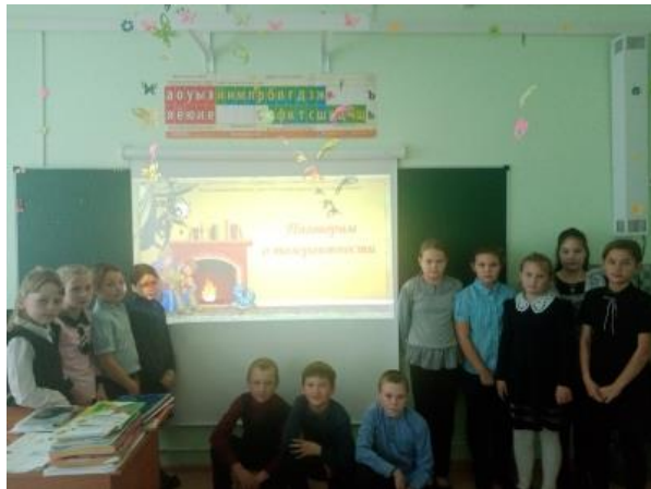
МО Балаганский район МБОУ Тарнопольская СОШ Просмотр видеороликов (5-9 классы)