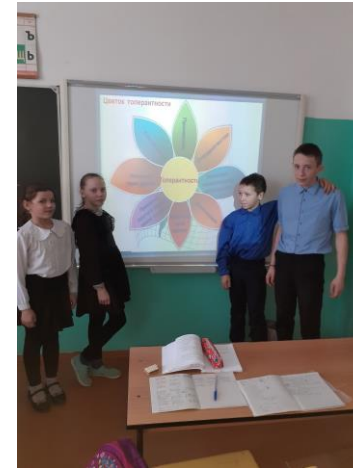
МО Балаганский район МБОУ Заславская СОШ Внеклассное мероприятие «Ты и я мы оба разные, ты и я мы оба классные» (7 класс)