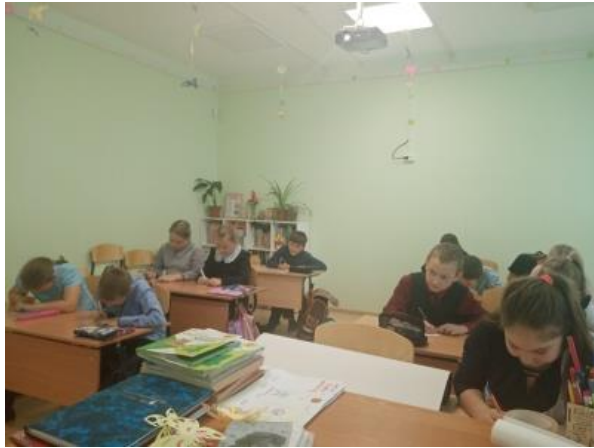
МО Балаганский район МБОУ Биритская СОШ Классный час «Толерантность – это...» (6 класс)